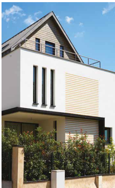
Des demandes croissantes pour la rénovation énergétique des maisons individuelles

Dans le cadre du dispositif de demande de subvention de la prime CEE en maison individuelle, Sto met à disposition de ses clients un interlocuteur dédié pour les accompagner dans la constitution de leur dossier. Sto se positionne comme un guichet unique, collecteur de CEE à la place des artisans auprès de la plateforme de son partenaire mandataire, EBS.