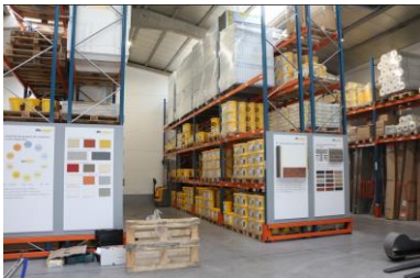
Sto'n'Go : plus de 300 articles toujours en stock dans les agences Sto