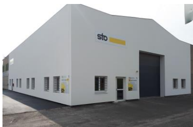
Le réseau de distribution de Sto est composé de 18 agences locales réparties sur l'ensemble du territoire national et d'une plateforme régionale à Lyon.

Résultat : des démarches administratives simplifiées, les primes CEE étant déduites de la prochaine commande auprès de Sto.