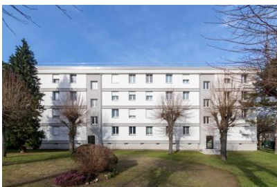
Copropriété de la rue de Saint-Cloud, Nanterre (92)

À près de soixante-dix ans, la copropriété de la rue de Saint-Cloud, à Nanterre, vit aujourd'hui une nouvelle jeunesse.