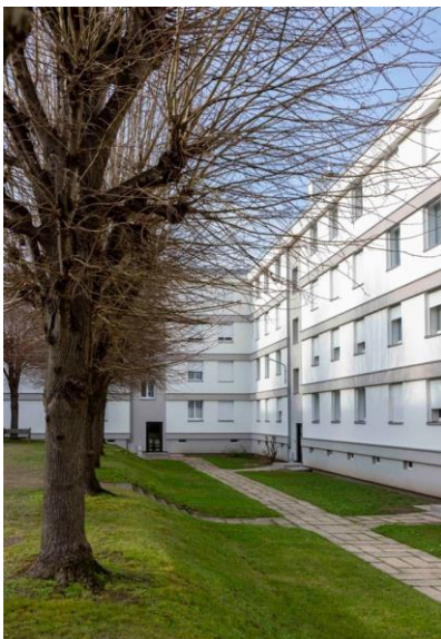
Copropriété de la rue de Saint-Cloud, Nanterre (92)

À Nanterre (92), un ensemble de quatre immeubles de logements réduit sa consommation d'énergie de 49 % grâce à de nouveaux équipements thermiques et au système d'isolation par l'extérieur StoTherm Mineral 1 avec une finition enduit. Une telle performance lui permet d'accéder à des aides financières substantielles.