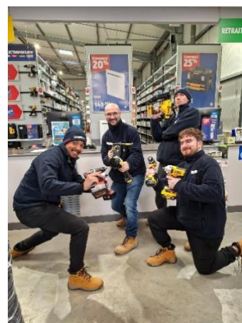
Screwfix de Sotteville-lès-Rouen