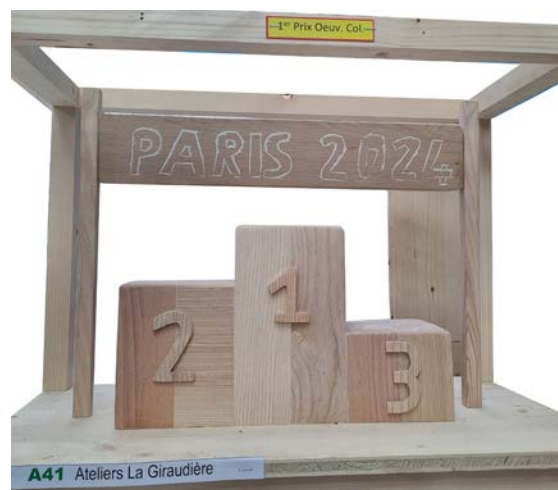
École la Giraudière - Prix Œuvre Collective

Les primés ont obtenu de nombreux lots : tablettes, drones, outils professionnels, vols en hélicoptère, journées d'initiation à l'aviron... et voyages.