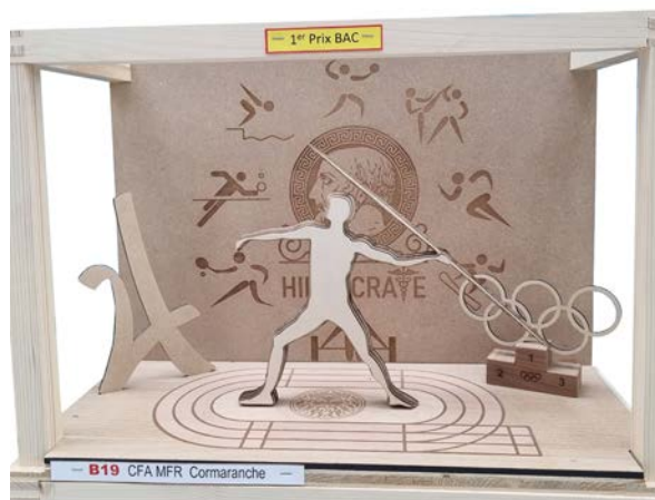
Trystan Billon - Prix BAC