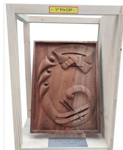
Matthéo Lombard - Prix CAP