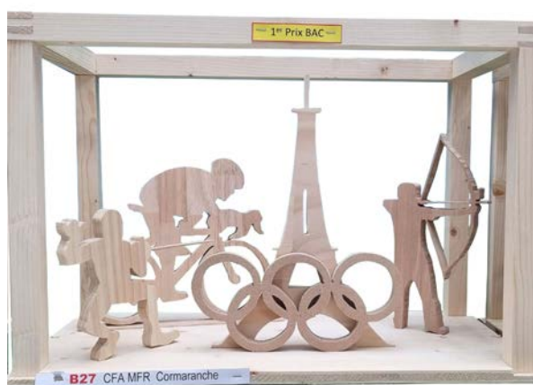
Antoine Coquard - Prix BAC