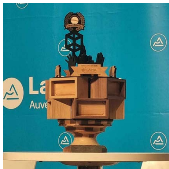
Coupe Challenge du Bois 2024