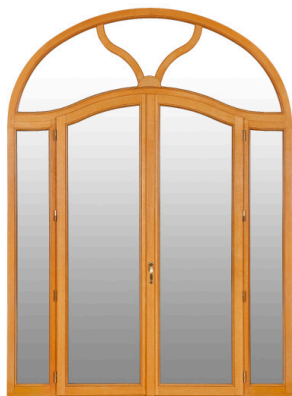
© Lorillard la menuiserie bois Tradition, dans une version 2 vantaux avec imposte vitrée équipée de petits-bois chapeau de gendarme.

Grâce à leur fabrication à partir de profils lamellé-collé, les menuiseries Tradition offrent une stabilité dimensionnelle et une résistance mécanique accrues. Cette méthode moderne de fabrication réduit également les déchets, contribuant ainsi à la préservation des forêts et à une utilisation plus efficace des ressources.