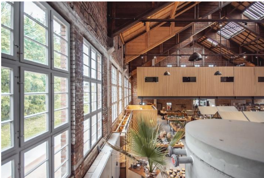
Image : Alte Reithalle Achern_Innen