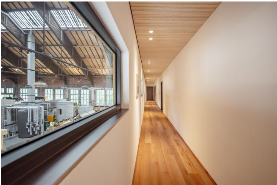
Image : Alte Reithalle Achern_Panoramafenster

Dans les bureaux, les plafonds Lignotrend couvrent partiellement des portées allant jusqu'à 10 mètres et contribuent à créer une atmosphère de travail agréable grâce à leurs propriétés acoustiques. Comme dans les appartements, la vue reste toujours dégagée sur le hall, permettant ainsi une intégration harmonieuse de l'ancien et du nouveau.