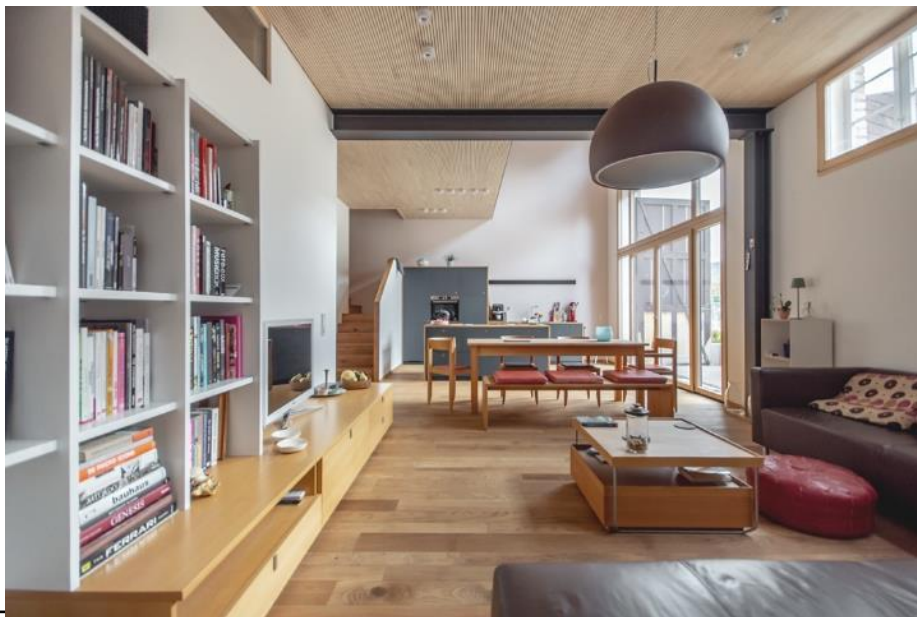
Image : Alte Reithalle Achern_Wohnküche