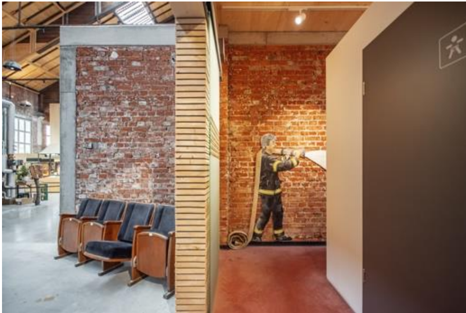
Image : Alte Reithalle Achern_Feuerwehrmann

L'ancien manège illustre parfaitement comment les structures historiques peuvent être revitalisées et comment l'ancien peut coexister harmonieusement avec le nouveau.