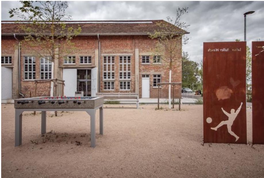
Images : Alte Reithalle Achern_Aussenansicht_1/2

Les maîtres d'ouvrage et les planificateurs n'ont rien changé à l'image de l'ancien manège. Tous soulignent à quel point la collaboration sur ce projet s'est déroulée sans accroc et de manière constructive - avec la ville, les autorités en charge des monuments historiques et toutes les autres parties prenantes. L'« Alte Tanke » (en haut sur la photo) complète le concept du marché couvert par un service de restauration extérieur très apprécié, avec un jardin de bière.