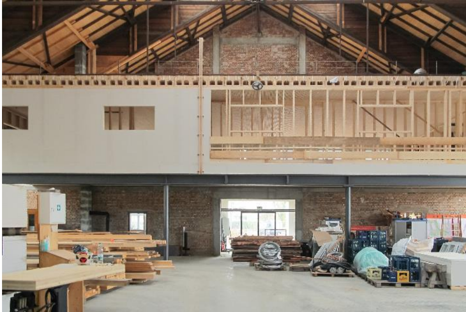
Image : Alte Reithalle Achern_Bauphase_1

Les nouveaux corps de bâtiment en bois, conçus pour la construction de la « maison dans la maison », ont été installés sur une ossature métallique et positionnés librement dans le hall. Les murs à ossature bois ont été réalisés de manière traditionnelle, tandis que les éléments de plafond sont constitués de bois lamellé-croisé Lignotrend, spécialement configurés pour cette tâche et optimisés pour une utilisation efficace des matériaux.