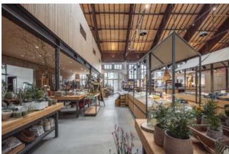
Image : Alte Reithalle Achern_Innenansicht_5/6/7

Les nouveaux volumes en bois sont intégrés dans le hall ou surélevés sur des piliers et des poutres en acier. Sous ces structures se trouvent les stands du marché couvert et des unités commerciales, créant ainsi une alternance harmonieuse entre les zones élevées et les espaces plus bas du hall.