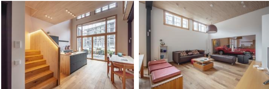
Image : Alte Reithalle Achern_wohnen_1/2