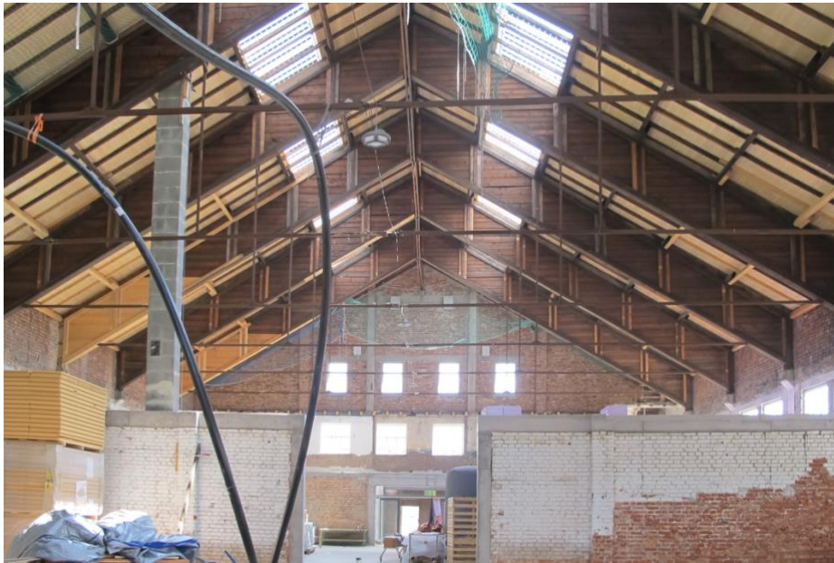
Image : Alte Reithalle Achern_Bauphase_3