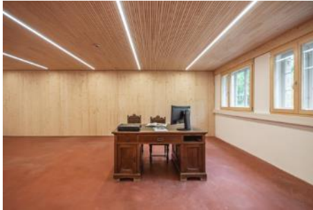
Image : Alte Reithalle Achern_Büro 1/2