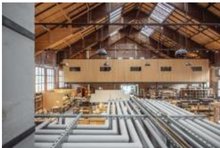
Image : Alte Reithalle Achern_Innenansicht_2/3/

Pour les maîtres d'ouvrage et l'architecte, il était crucial de ne pas surcharger le hall de fonctions afin de préserver une clarté visuelle entre les différentes zones. Vue de hauteur, le concept d'espace dans l'espace et l'envergure du grand hall sont particulièrement bien mis en valeur.