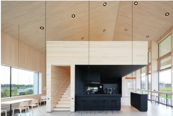
Photo 3 : 22_TRA_Gastraum — Galerie und offene Gastroküche.jpg

La mise en valeur de la zone de service est inhabituelle. Le panneau Ligno® Acoustique en bois véritable a été entièrement peint en noir.