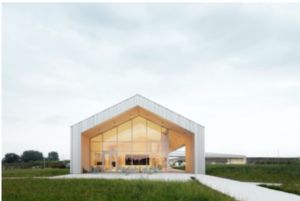
Photo 2 : 10_TRA_Giebelansicht Ostseite - Blick in den Gastraum.jpg

Le concept minimaliste dégage une impression de calme et de sérénité en contraste avec la rapidité de l'autoroute.