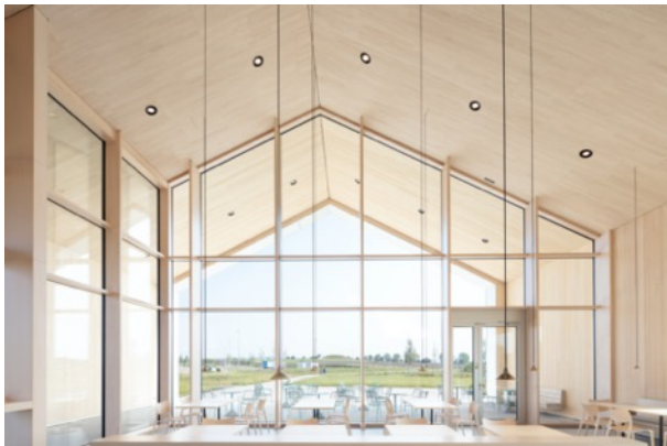
Photo 6 : 27_TRA_Gastraum — Blick zum Fürstenhügel.jpg

La large façade vitrée offre une vue dégagée sur la colline du site archéologique.