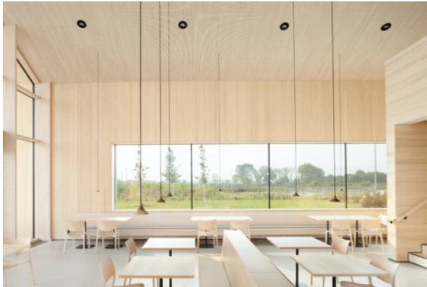
Photo 5 : 25_TRA_Gastraum Panoramafenster.jpg

Le bois de sapin blanc sans nœuds marque profondément l'intérieur du bâtiment.