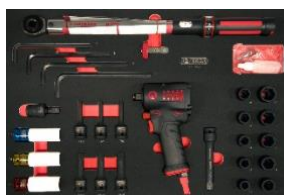
Module spécifique : roues et freinage