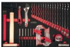
Module de serrage et frappe