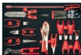
Module de pinces