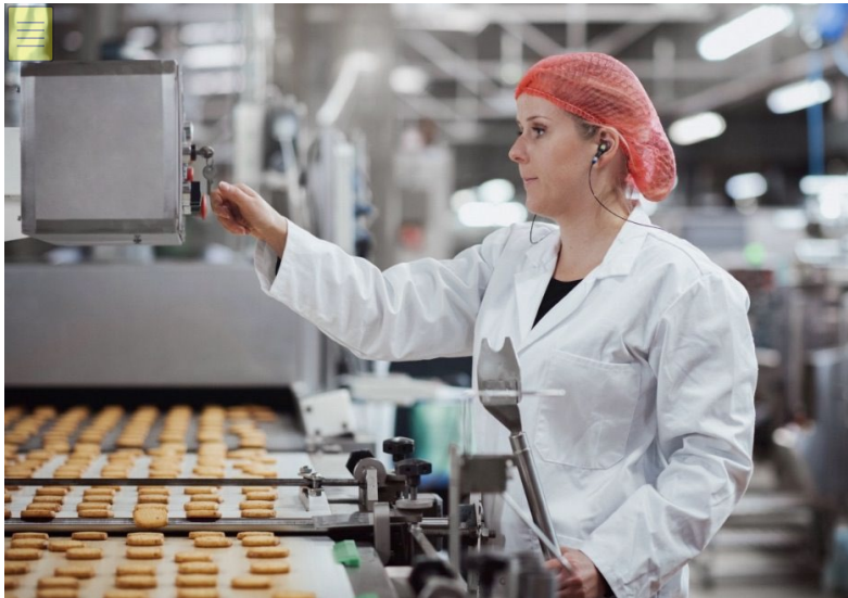
Cotral Lab apporte une solution adaptée aux exigences de l'industrie agroalimentaire.