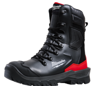
Chaussures de sécurité ARMOURTRED™ S3S HRO SC FO LG SR Tige basse, avec système BOA®