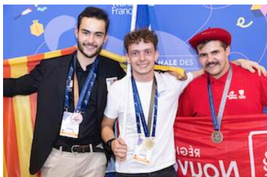
Podium Médailles d'or, d'argent et de bronze