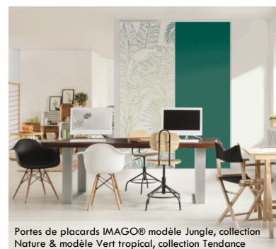
Portes de placards IMAGO® modèle Jungle, collection Nature & modèle Vert tropical, collection Tendance

Le concept Imago® offre des arguments séduisants pour attirer les jeunes architectes à la recherche d'innovations et d'idées originales , en accord avec les exigences parfois strictes des cahiers des charges. En laissant libre cours à leur créativité, Imago® est une toile idéale pour exprimer leur vision architecturale.