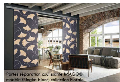
Portes séparation coulissante IMAGO® modèle Gingko blanc, collection Florale

Pour plus d'informations : www.coulidoor.fr