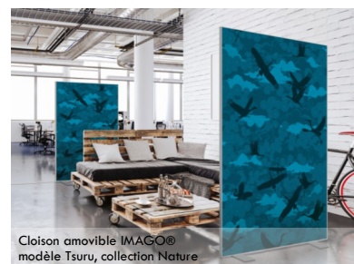
Cloison amovible IMAGO® modèle Tsuru, collection Nature