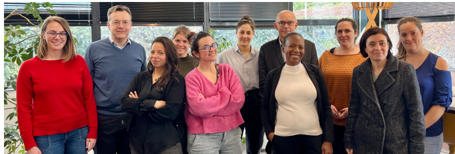
Photo de l'équipe d'experts dédiée de Valdelia

Suis-je concerné(e) par la REP Bâtiment ? Comment remplir mes obligations réglementaires ? Comment l'éco-organisme Valdelia gère-t-il la fin de vie de mes produits mis sur le marché ? Comment être prêt(e) au 1er mai ? Autant de questions auxquelles les experts dédiés de Valdelia pourront répondre.