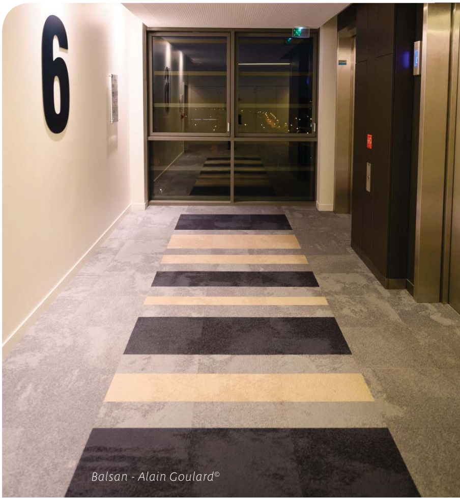
Balsan - Alain Goulard®