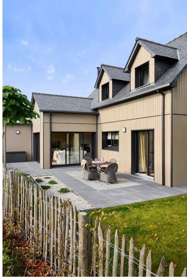
[Trecobois] Maison en ossature bois