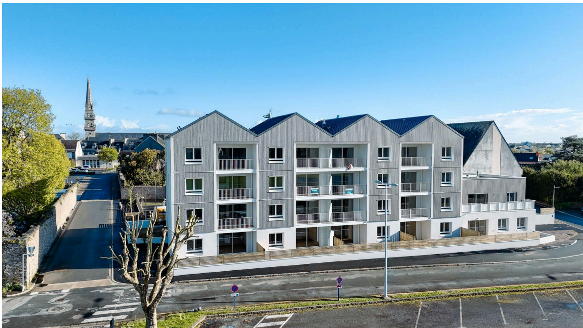
[Amenatys] Programme immobilier OYAT à Ploudalmézeau (29)