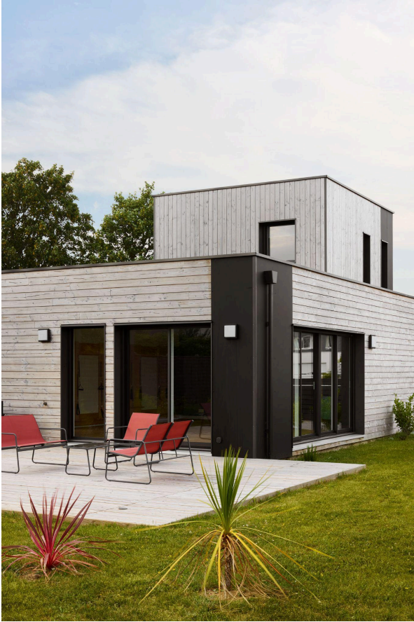
[Trecobois] Maison en ossature bois