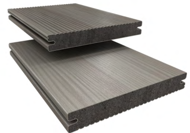
TWINSON Majestic Massive Pro

Zoom sur le modèle phare et tendance : Twinson Majestic Massive Pro , une lame de terrasse 100 % recyclable , facile à poser, composée de matériaux ultra-résistants (tâches, griffes, ...) et facile à entretenir.