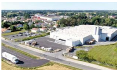
Les gammes Irtop PluS sont fabriquées dans l'usine vendéenne Sto de La Copechagnière.