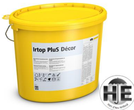
La nouvelle gamme de revêtements d'imperméabilité Irtop Plus est disponible en version « Hors d'Eau renforcé » pour une application par temps froid et humide.

Avec le nouveau conditionnement de 7 kg, il devient également plus facile de gérer les retouches, les mises en peinture de petites surfaces ou des éléments StoDeco (corniches, appuis de fenêtre, etc.). Fini le gaspillage !