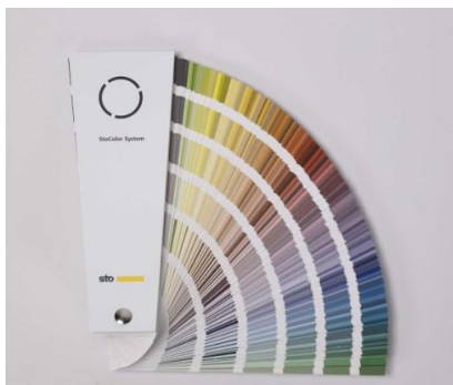
Nuancier StoColor System Plus de 1 000 teintes disponibles