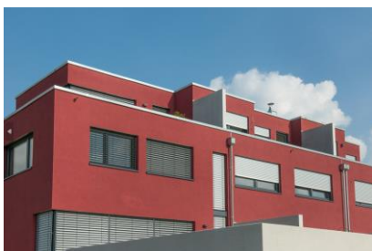
Grâce à la technologie X-Black, les teintes plus soutenues sont permises, en toute conformité avec la réglementation.

Avec plus de 1 000 teintes disponibles dans le Nuancier StoColor System, les revêtements Irtop PluS offrent une très large gamme de couleurs sur le marché de l'imperméabilité, y compris foncées. Grâce à des pigments spéciaux qui réfléchissent le rayonnement infrarouge, la technologie X-Black limite l'échauffement de la façade. Fini les risques de fissures prématurées et de vieillissement accéléré ! Les teintes foncées ou vives sont permises, en toute conformité avec la réglementation.