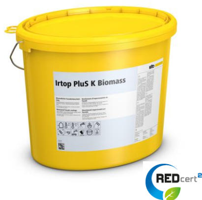
Irtop PluS Biomass : la 1 ère gamme de revêtements d'imperméabilité issue de la biomasse certifiée REDcert²