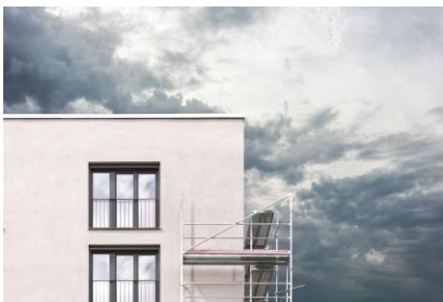
Sto a mis au point des versions spécifiques de ses produits d'imperméabilité de façade pour une application adaptée à la saison froide et humide.

Alors moins soumises aux aléas climatiques, les entreprises applicatrices vont pouvoir poursuivre leur activité et augmenter le nombre de chantiers réalisés dans l'année. Un avantage indéniable qui vient s'ajouter à la longue liste de ceux déjà offerts par sa nouvelle gamme de revêtements d'imperméabilité de façade Irtop PluS.