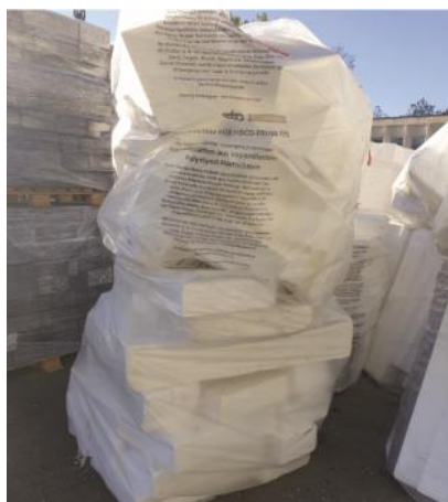
Recyclage des chutes de polystyrène expansé