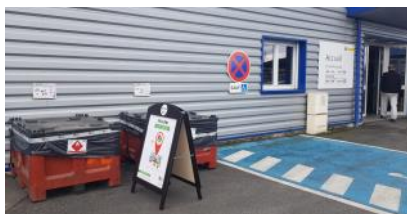
Borne Rekupo installée dans l'agence Sto de Thonon