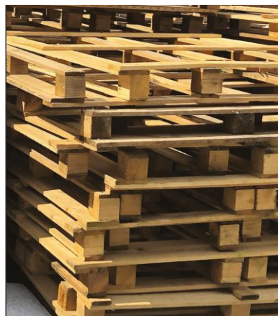
Reprise des palettes Europe