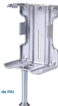
Grip HM de PAI