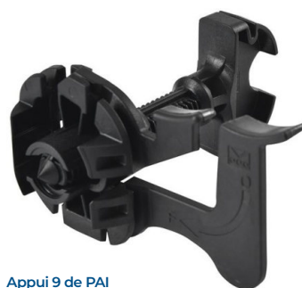
Appui 9 de PAI

Mais également le Grip HM, solution révolutionnaire de fixation pour suspente ou tige filetée avec cavalier pour la pose d'un faux plafond sous plancher hourdis.