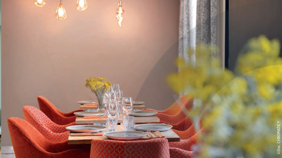
EVOLUTEX BAS CARBONE CH2 0736 Vert