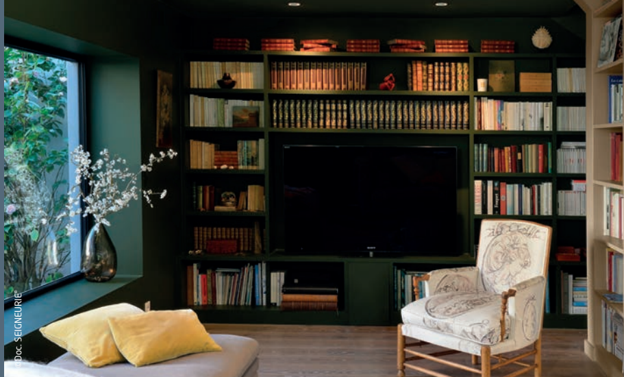
EVOLUTEX BAS CARBONE CH2 0736 Vert Zapfino