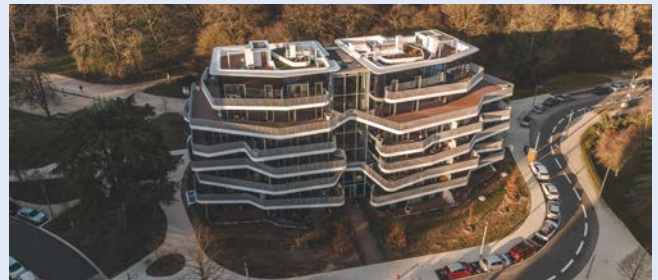
Résidence Canopée - © R CRAFT VISUALS

A découvrir en détail sur www.schoeck.com/fr/40-ans-isokorb