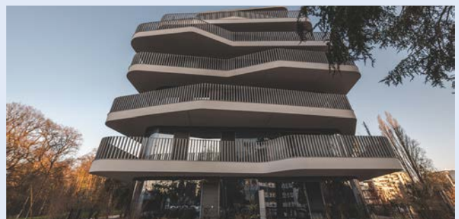
Résidence Canopée

Une expertise hors pair... Schöck France, filiale basée à Entzheim (près de Strasbourg), développe et commercialise un ensemble de solutions ultra-performantes de traitement de ponts thermiques. La gamme Schöck Rutherma® / Isokorb® répond aux différents défis des constructions en proposant des solutions sur mesure pour des liaisons béton-béton, béton-acier, acier-acier ou encore béton-bois.