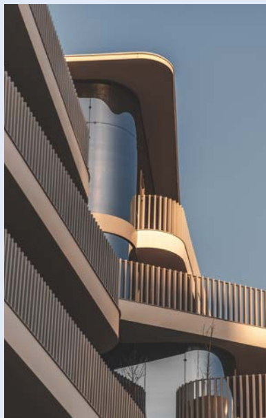
Résidence Canopée