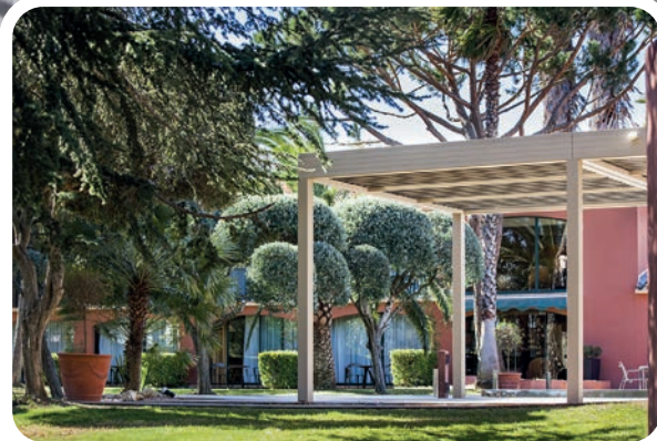
Doc. Villa Dufour Perpignan - Richard Sprang - Profils Systèmes

Autre référence Profils Systèmes, la pergola rétractable Wallis&Outdoor® offre une protection modulable en vue de s'affranchir des aléas climatiques : grande ouverte pour un vrai bain de lumière, partiellement rétractée privilégiant ainsi une zone ombragée, intégralement fermée afin de se préserver de la pluie ou du soleil. Bénéficiant d'une ouverture silencieuse et progressive (en seulement 30 secondes pour une pergola de 4m de profondeur), les lames, une fois rétractées, occupent un espace minime de la surface, en totale discrétion !