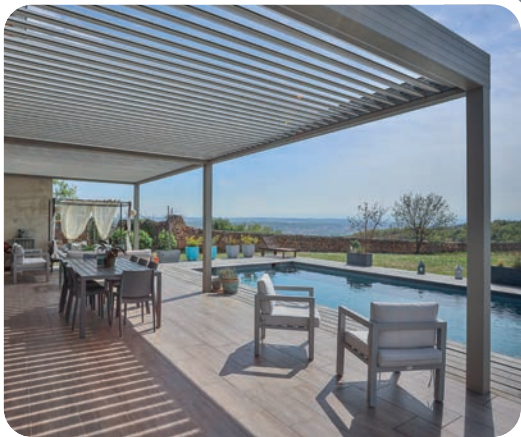
Pergola bioclimatique Wallis&Outdoor® à lames motorisées Fixation murale, 3 poteaux Finition : RAL F7030, finition givrée