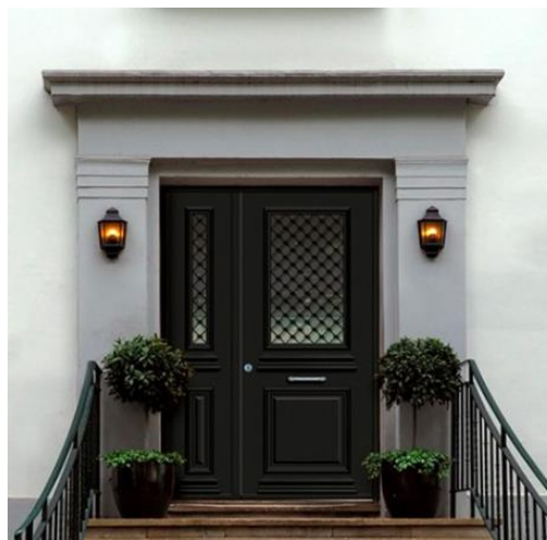
Modèle Safira 31 - Noir 2100 sablé - Cimaies décoratives extérieures – Grille G006 vitrage imprimé 200 en option. Version pour panneau à parcloser sans cimaise basse : Lucéna 1 - Poignée Némò.