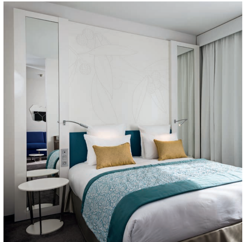
Tête de lit et mobilier : Blanc Absolu - FA - Stratifié Compact Monochrom

Enfin, soulignons que Polyrey met à disposition des porteurs de projets sa bibliothèque digitale « Signature Library », régulièrement actualisée donc toujours au cœur des tendances, offrant un très large panel de plus de 300 décors . Par ailleurs, Polyrey propose également un service de personnalisation « Signature Création » permettant de créer des décors uniques et exclusifs.