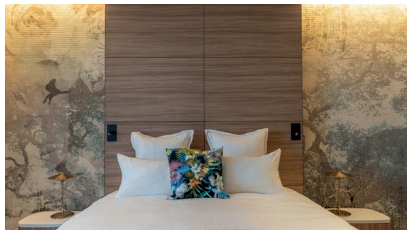
Tête de lit : Noisetier Naturel - Extramat - Mélaminé Panoprey®