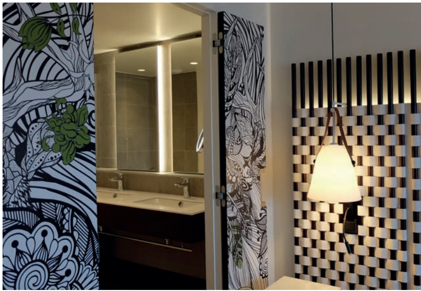
Portes : décor personnalisé « Signature Création »

Précisons aussi que la pose de mélaminés et stratifiés Polyrey s'accompagne d'une propreté d'intervention exemplaire (aucune bâche nécessaire pour prévenir les coulures de peintures par exemple, très peu de poussière) et d'une mise à disposition ultra rapide des locaux (exit les temps de séchage de colle interminables), répondant pertinemment aux enjeux du marché de la construction en général et du segment hôtelier en particulier (délais de chantiers raccourcis et optimisation de la rentabilité).