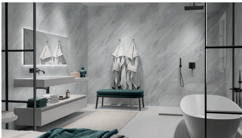
Habillage Mural : Marbre Sirocco - Extramat - Nuance

D'entretien facile , les solutions Polyrey bénéficient intrinsèquement d'une protection Sanitized® à base d'ions argent, garante d'une hygiène optimale (destruction de plus de 99,9 % des bactéries) tout au long de leur vie. A très faibles émissions de COV, sans nanoparticule et chimiquement inertes, elles sont classées A et A+, contribuant à préserver la qualité de l'air intérieur. Elles bénéficient aussi des certifications Greenguard et Greenguard Gold reconnues par les programmes de développement durable et emblématiques de l'engagement de Polyrey pour un environnement protégé ainsi qu'une santé préservée.