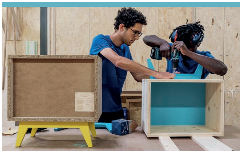
L'Atelier Emmaüs de Villeurbanne (69)

Créé en 2017 à Villeurbanne, l'Atelier Emmaüs émane du Mouvement Emmaüs qui lutte contre l'exclusion depuis 1949.