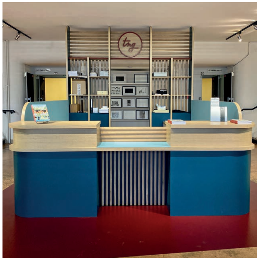
Théâtre Nouvelle Génération - Centre dramatique national de Lyon