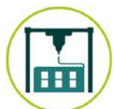
Impression 3D in situ