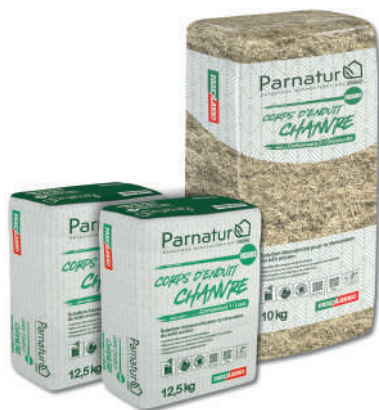
PARNATUR CORPS D'ENDUIT CHANVRE

Le fabricant mettra en exergue les deux premières solutions de sa gamme biosourcée PARNATUR : PARNATUR CORPS D'ENDUIT CHANVRE et PARNATUR ISOLANT FIBRES DE BOIS.