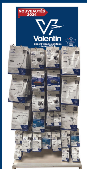
Brochable en rayon