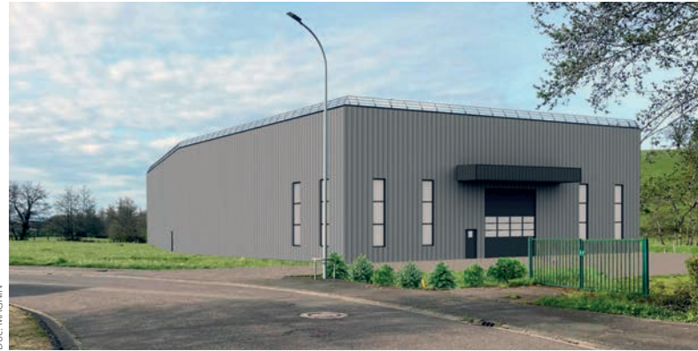
Ci-dessus le nouveau bâtiment de stockage de 1750 m 2

Dans le même temps, MAGNIN a prévu de s'équiper de nouvelles machines de dernière génération. Ainsi, le site de production accueillera, dès février 2024, une nouvelle machine à commande numérique équipée d'une tête 5 axes et d'une tête 4 axes avec pont et ventouses à placement numériques pour faciliter et fiabiliser la production de marches balancées, avant la réception d'un centre de débit pour marches droites programmée ultérieurement. Pour compléter la réorganisation du site, mentionnons qu'un bâtiment de stockage sera également construit.