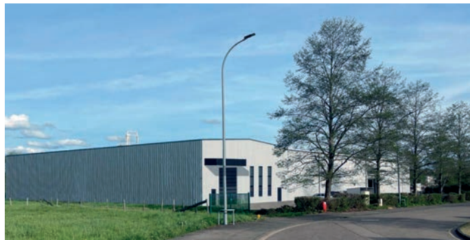
Ci-dessus l'extension de 2000 m 2

Enfin, pour accompagner ses investissements, l'entreprise travaille en parallèle sur la refonte de ses gammes de produits et de services, avec pour objectif de présenter à ses clients une offre renouvelée et élargie pour répondre au plus près de leurs besoins. Elle prévoit également à terme le recrutement de plus de 15 personnes d'ici 2026 pour étoffer ses différents services (service commercial, bureau d'études, production).