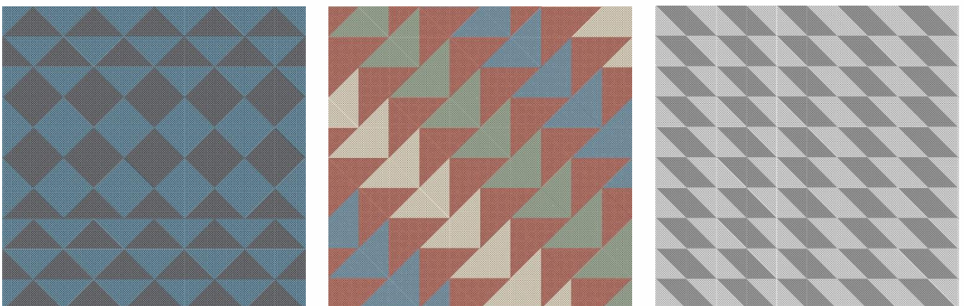
Exemples de création architecturale

La gamme METAL Creative est certifiée Cradle to Cradle® Argent . Sa Déclaration Environnementale Produit (FDES) a été validée conforme aux exigences de la norme ISO 14025 par l'organisme indépendant IBU (Institut Bauen und Umwelt e.V.).