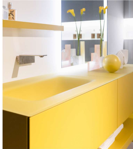
Dogma en jaune laqué mat « bikini yellow »