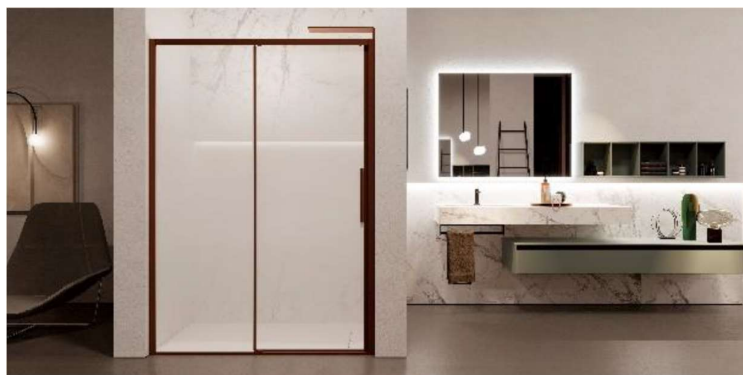
composition Sense et nouvelles finitions METAL pour les douches