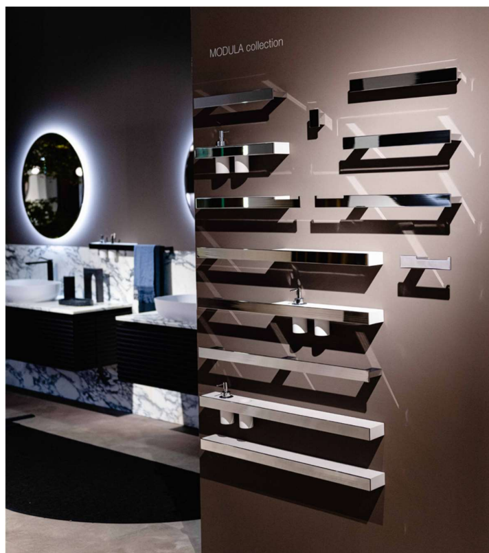
Collection d'accessoires Module, et nouveau miroir Eclissi (nouveau 2023, dans le prochain catalogue)

Seront également exposés : le plan Cubik avec coupe à 52° en grès « Ardesia » , la gamme complète d' accessoires de salle de bain Modula , les nouveaux lavabos Pool en céramique noire mate et Dream en céramique blanche mate , deux nouveaux miroirs – Deka et Eclissi – ce dernier avec un système d'éclairage qui crée des atmosphères propices au calme et à la détente (il offre la possibilité de changer la texture de la lumière en choisissant entre lumière chaude et froide )