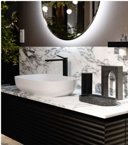
Dolce Vita en version chêne foncé et nouveau marbre !

Egalement pour la collection Dolcevita l'essence de chêne s'ajoute à celle "naturelle" (blanchie, vison, fumée, brique, sombre).