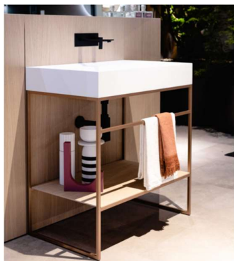
Dogma sur structure aluminium

Ideagroup, marque italienne de mobilier de salles de bains, sera présente sur ISH Du 13 au 17 mars (hall 3.1, stand D81).