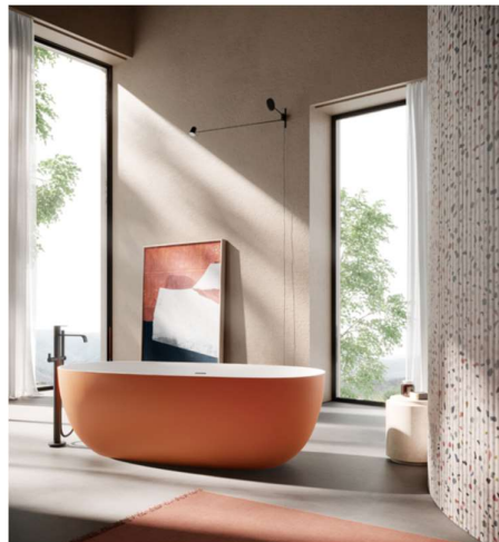
Nouvelles baignoires colorées de style « rétro » ou contemporain !