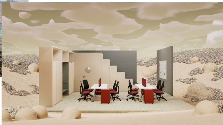
Passion for color en Vanilla Cream