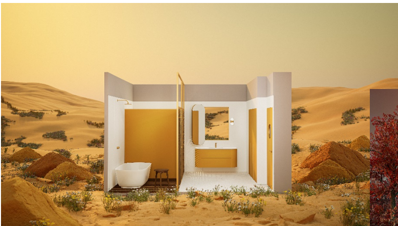
Passion for color en Curcuma Gold