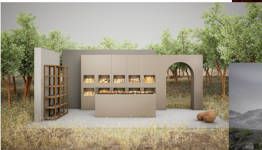
Passion for color en Nutmeg Brown