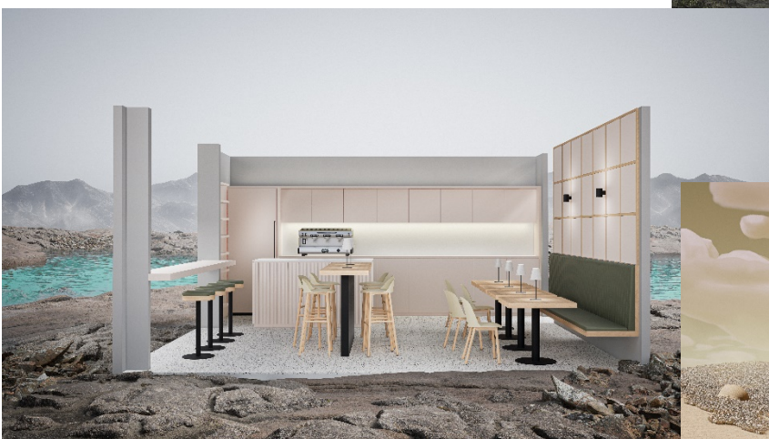
Passion for color en Pink Salt