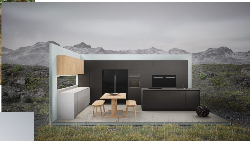
Passion for color en Pepper Grey