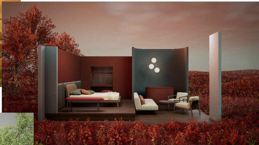
Passion for color en Ground Chili