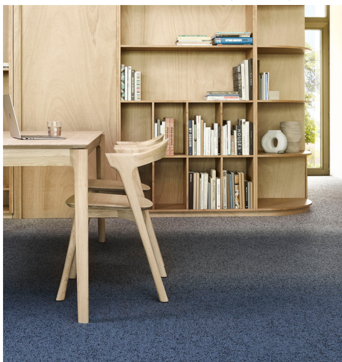
FUSE 8823, FUSE 8804, FIELDS 8822, FIELDS 8332, FIELDS 9515

Téléchargez les images ICI Styliste: Bregje Nix