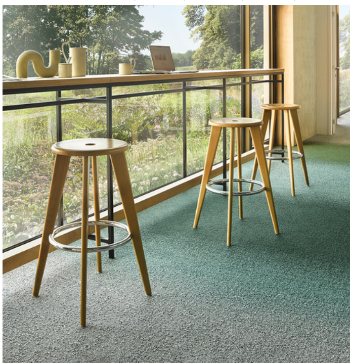
FUSE 7915, FUSE 7843, FUSE 7854, FIELDS 9515, FIELDS 7814, FIELDS 7231