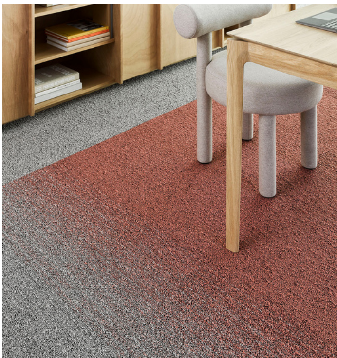
FUSE 1915, FUSE 2956, FIELDS 4438, FIELDS 209, FIELDS 9515