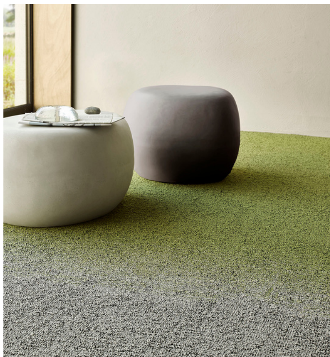
FUSE 7073, FIELDS 7072, FIELDS 9515