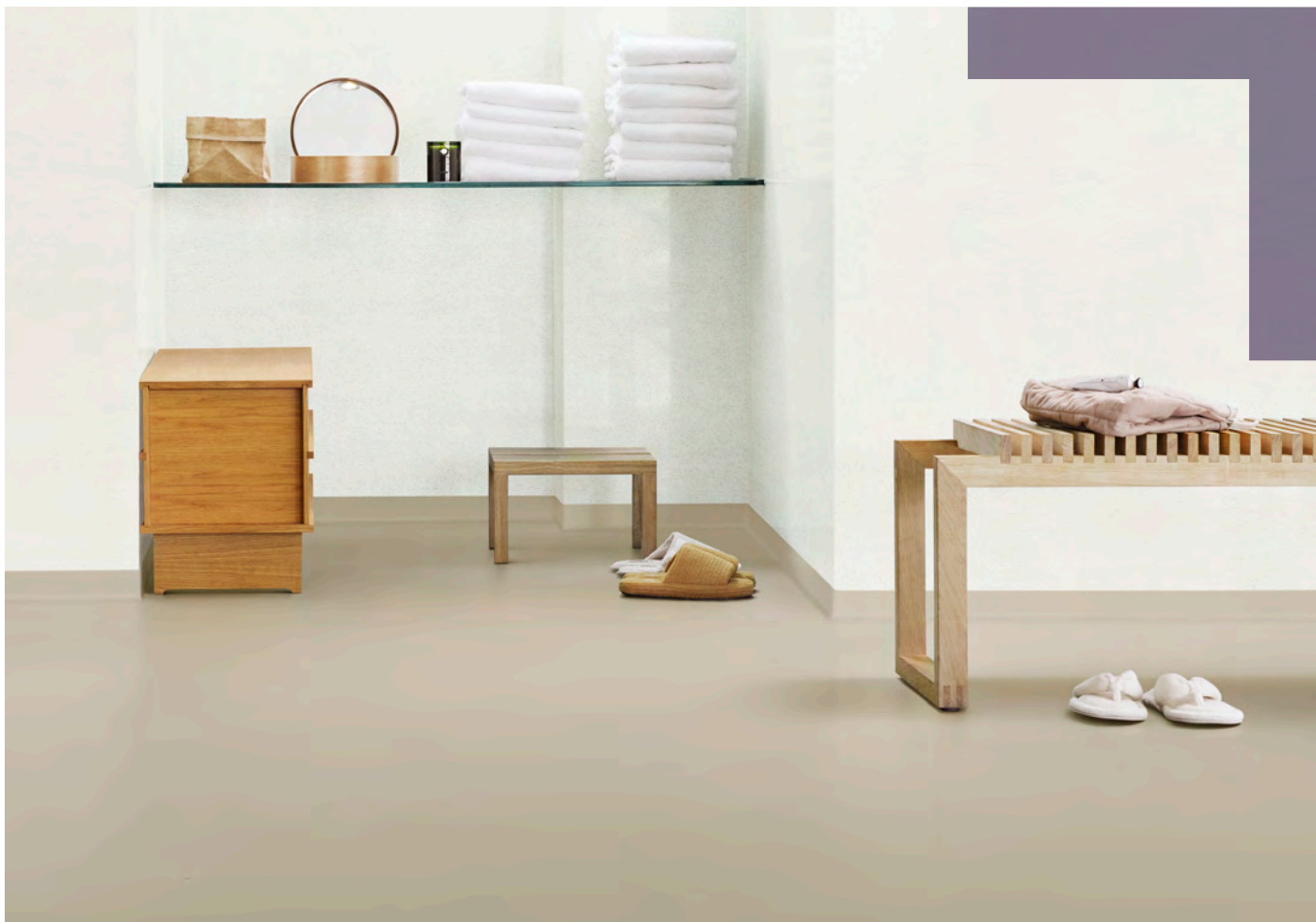
Sol : Surestep laguna sand. Mur : Onyx+ hessian ivory