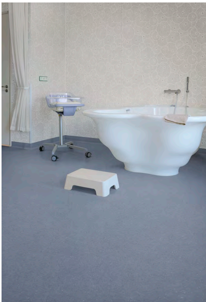
Sol : Surestep balance grey lavender. Mur : Onyx+ lotus ivory