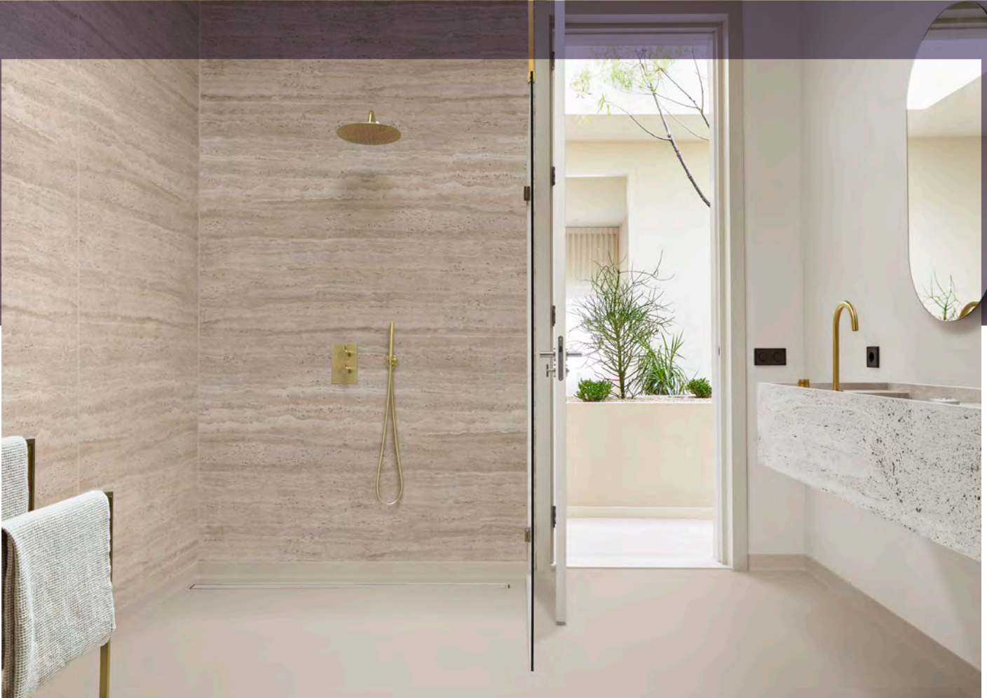
Sol : Surestep balance limestone. Mur : Onyx+ travertine natural et Onyx+ uni ivory