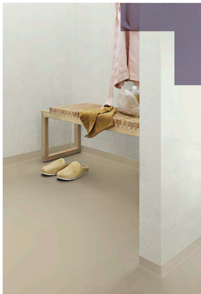
Sol : Surestep laguna sand. Mur : Onyx+ hessian ivory