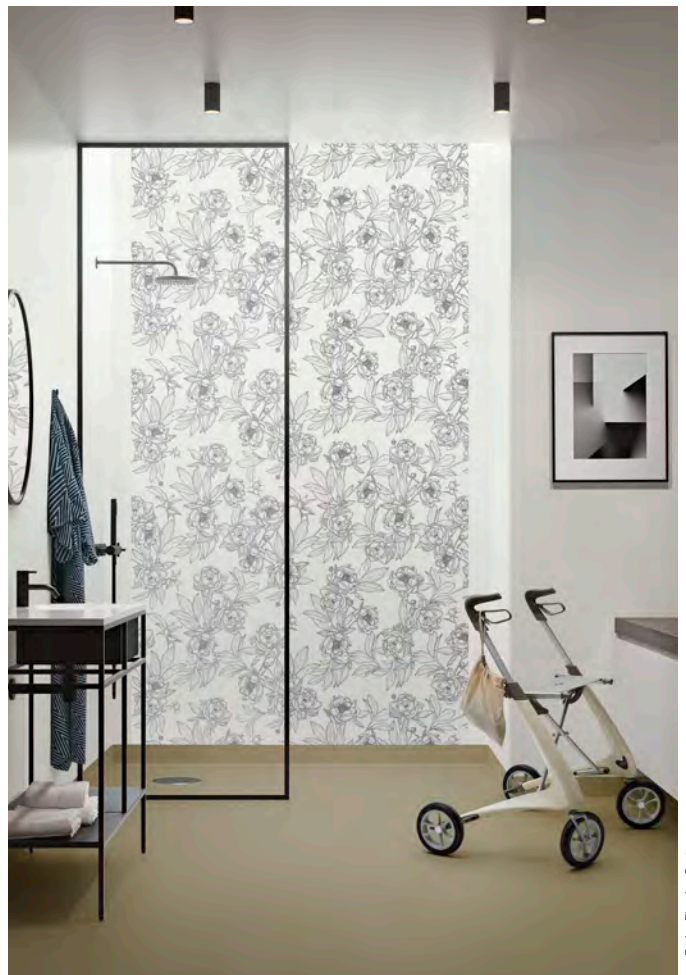
Sol : Surestep original moss. Mur : Onyx+ uni ivory et Onyx+ peony grey