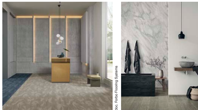
A gauche : Flotex advance latitude linen et latitude tempest A droite : Sarlibain - Sol : Surestep wood grey oak. Mur : Onyx+ marble white et Onyx+ uni ivory

Le textile floqué Flotex next , ensuite, rejoint la famille des solutions en pose 100 % libre , dont Forbo Flooring s'avère leader. En effet, grâce à l'usage de la bande de jonction Modul'up, Flotex bénéficie désormais d'une pose non collée, facile, rapide et économique . A la clé, une réduction des coûts de mise en œuvre et du temps d'immobilisation des locaux 1 , tout en préservant les performances de résistance, durabilité et confort qui font la réputation de la gamme Flotex.