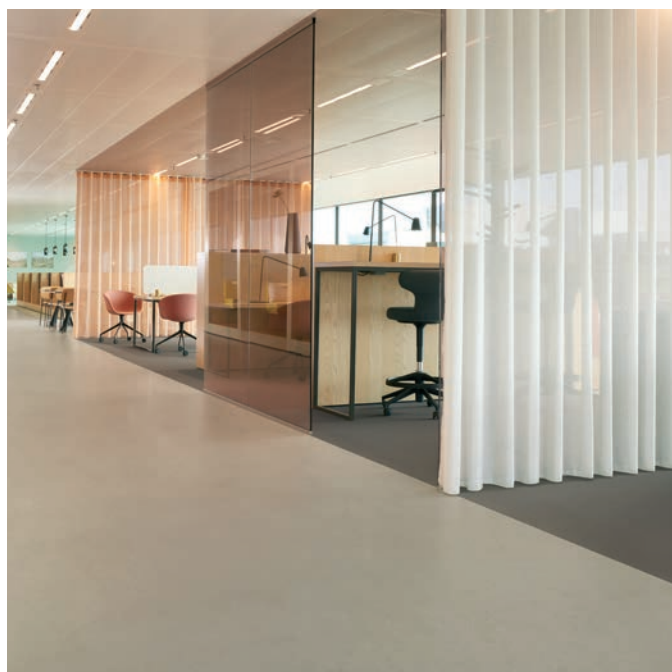
Marmoleum solid concrete pine forest