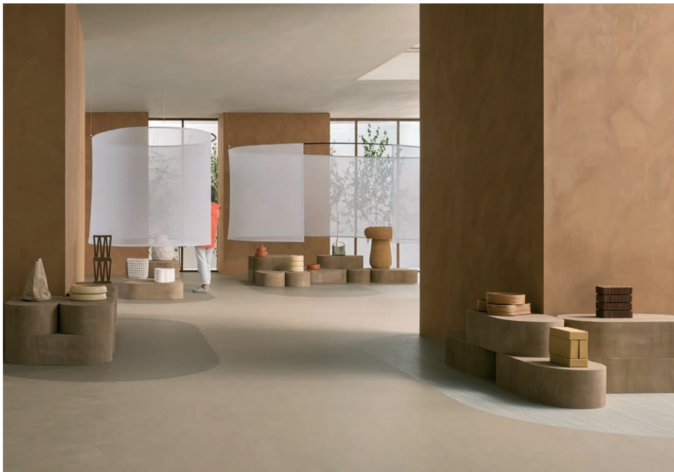
Marmoleum solid concrete drift et silt associés à Marmoleum striato rocky ice

Par ailleurs, la FDES s'accompagne, au niveau international, d'une EPD (Environmental Product Declaration), laquelle permet de présenter une empreinte carbone négative.