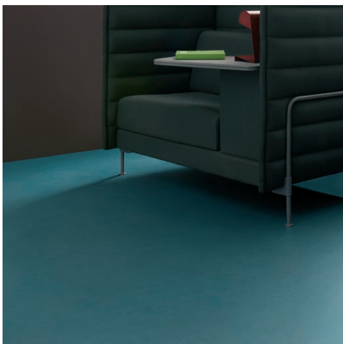
Marmoleum solid concrete Artic