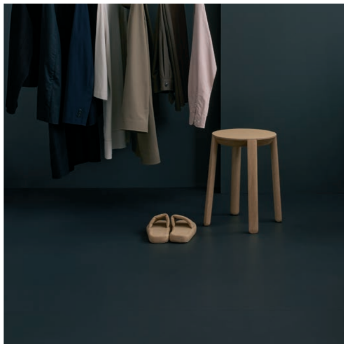
Marmoleum solid cocoa curcuma