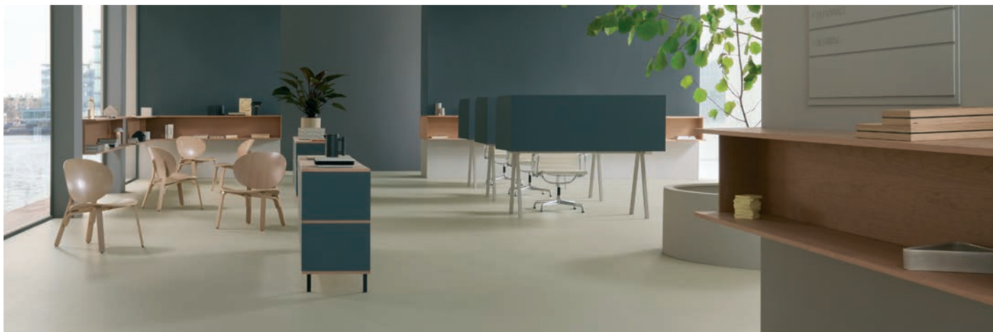
Marmoleum solid walton strucco