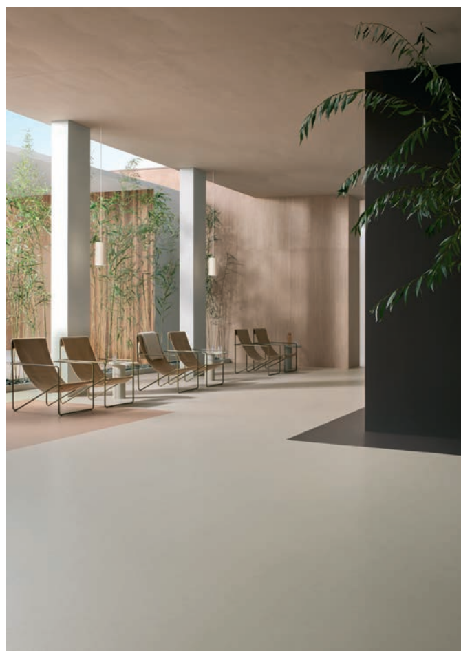
Marmoleum solid cocoa salted caramel et meringue associés à Marmoleum solid walton eggplant purple

Marmoleum solid décline 4 gammes, cocoa , walton , concrete et piano , s'adaptant à un large panel de segments (résidentiel, santé, éducation, hôtellerie, tertiaire...), alliées des zones à fort trafic. A la clé : des espaces sereins, où les personnes se déplacent, travaillent, se reposent, se divertissent et s'épanouissent.