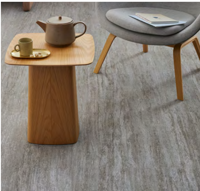
Flotex lames sierra cascade