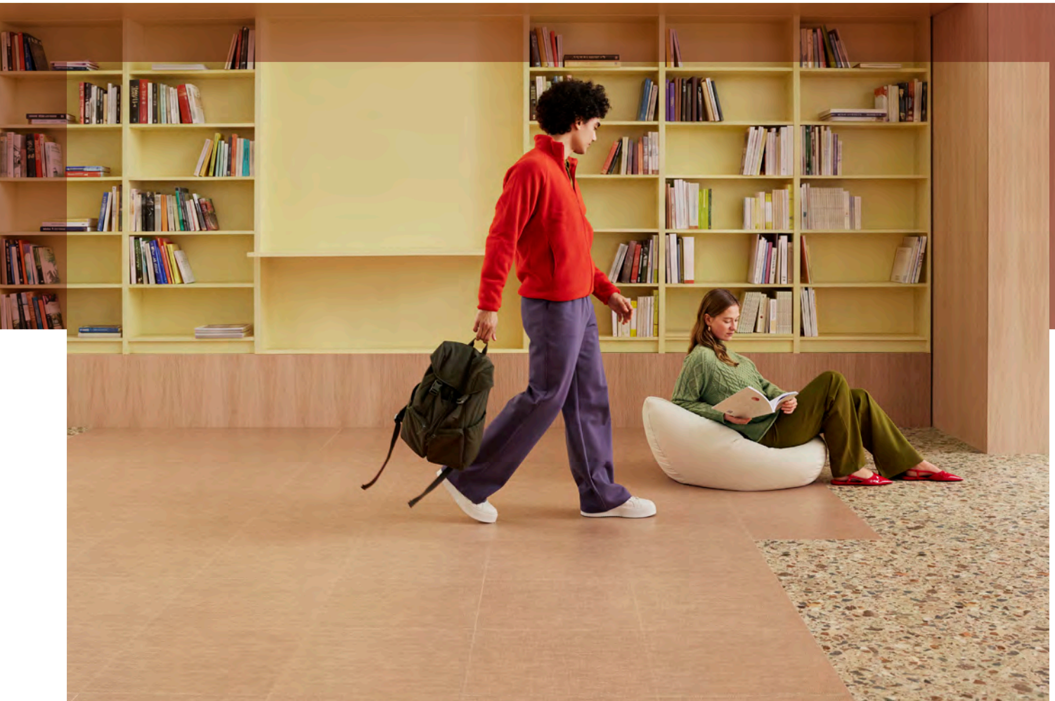
Allura decibel terra terrazzo et peach twill