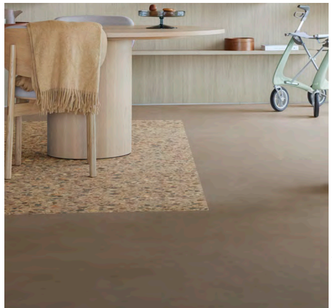
Allura decibel ivory antique oak