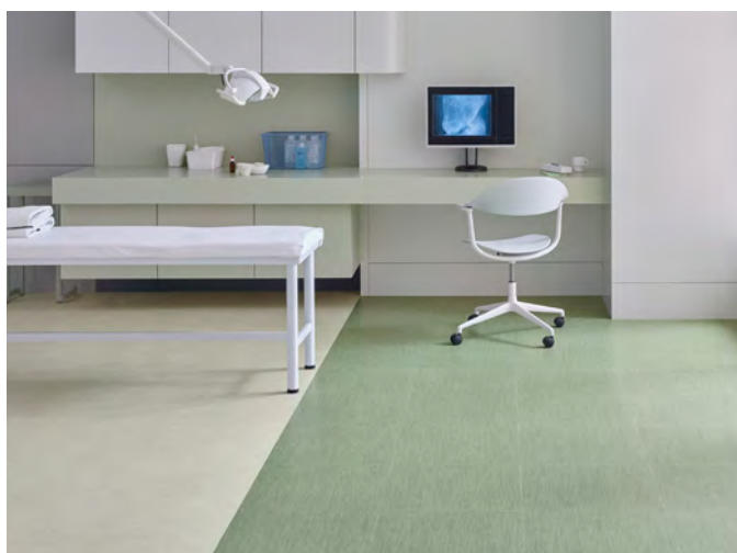
Allura decibel bianco perlino et pistacchio twill

À propos du Groupe Forbo. Acteur international majeur du revêtement de sol souple, le Groupe Forbo est le numéro 1 mondial sur le marché du linoléum et des sols textiles floqués (environ 5 050 personnes, au sein de 25 unités de production & de distribution, 6 centres de fabrication et 47 organisations de vente dans 39 pays, pour un chiffre d'affaires 2025 de 1 085,4 millions de francs suisses). Sa branche revêtements de sol "Forbo Flooring Systems" offre une large palette de revêtements et solutions décoratives pour les marchés professionnels et résidentiels. Linoléums, PVC, textiles aiguilletés compacts, textiles floqués, dalles tuftées et systèmes de tapis de propreté souples et rigides, conjuguent fonctionnalité, couleurs et design, offrant des solutions complètes adaptées à tous les environnements.