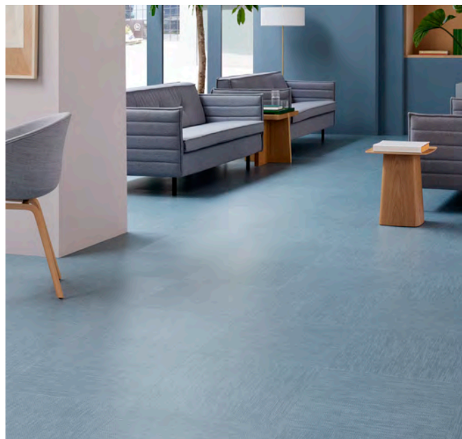
Allura decibel bronze pompeii