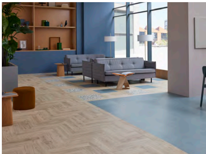
Allura decibel pale authentic oak, blue sky twill et opal terrazzo

Allura Decibel b+ conserve par ailleurs la richesse de formats, effets décoratifs et harmonies chromatiques qui caractérise l'offre, permettant de conjuguer exigence environnementale, durabilité et liberté de conception.