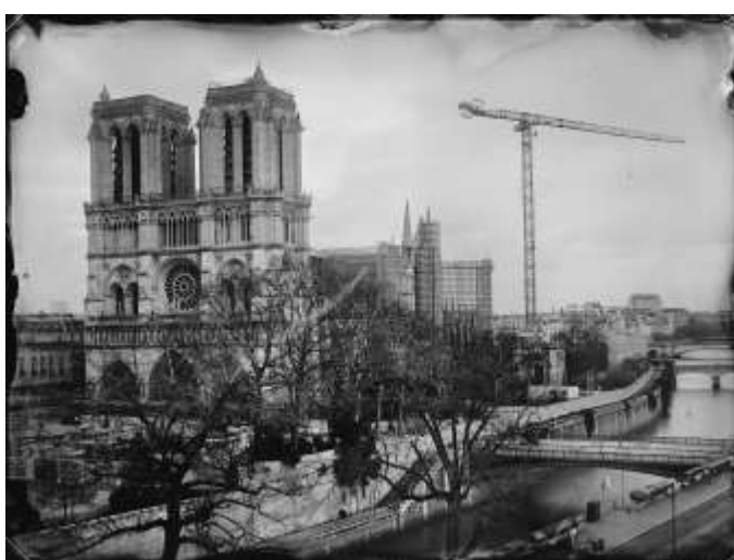
Visuel 4 – Le chantier actuel de restauration de Notre-Dame de Paris (21 janvier 2022)

Frédérique Meyer Responsable relations presse et partenariats médias frederique.meyer@ndp.fr +33 6 21 09 82 74