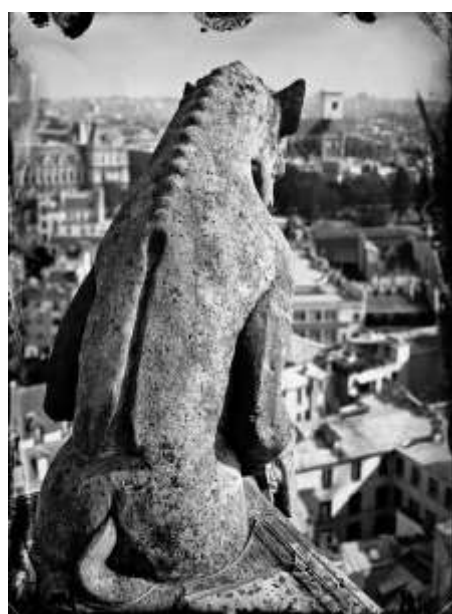
Visuel 3 – Chimère de la balustrade de la tour nord