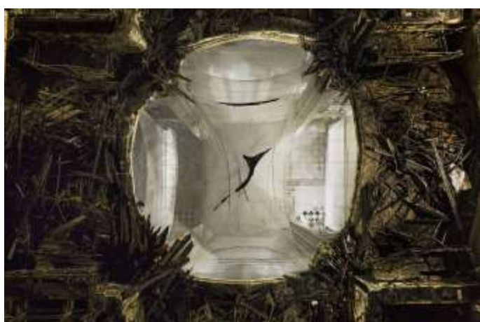
Visuel 1 – Le trou formé par la chute de la flèche, à la croisée du transept (23 novembre 2020)