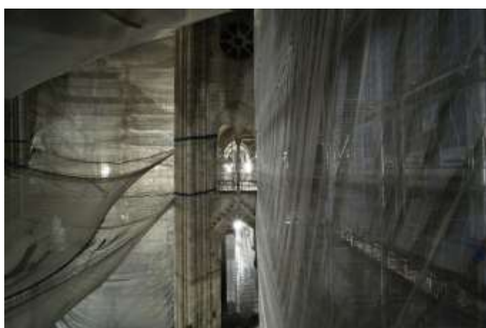
Visuel 2 – La cathédrale, de nuit, après le départ des compagnons (10 décembre 2020)