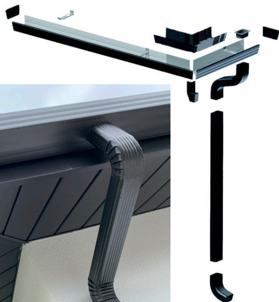
Solution INOA de DAL'ALU intégrée à une avancée de toit tout alu.