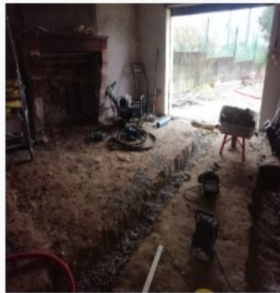
Rénovation maison ancienne