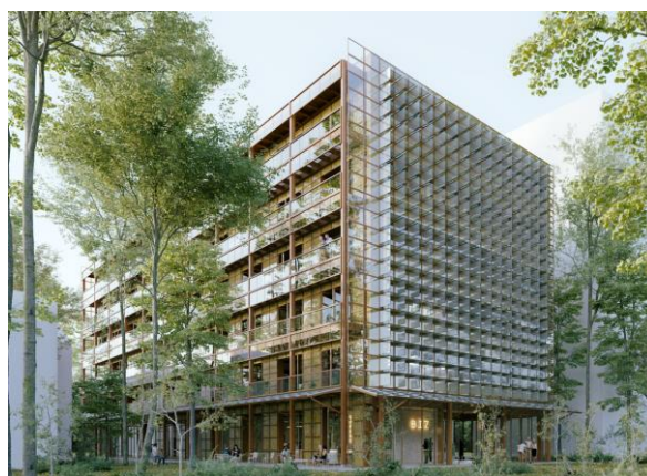
© NeM / Niney et Marca Architectes

Le projet mise sur le réemploi des matériaux et l'approvisionnement local. À partir d'un projet francilien en déconstruction, des éléments ont été identifiés et ont structuré l'ensemble du projet. Ainsi, de nombreux matériaux réemployés trouveraient une seconde vie. À l'exemple de la façade qui est composée à 75% de châssis de réemploi qui font office de bardages et brises soleil, ou encore des murs en béton recyclé qui jouent le rôle de régulateurs thermiques en se déchargeant de leur chaleur ou de leur fraîcheur.