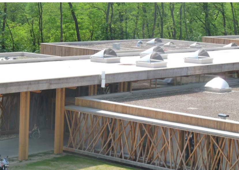
Des lanternes avec protections solaires sur le toit du Mas Les Floralties : une réalisation architecturale.

Conçu pour protéger des rayons du soleil en été par projection d'ombre et pour laisser entrer la chaleur en hiver par réflexion sur la tôle perforée, le Voile-Dôme offre une efficacité énergétique passive maximale. En utilisant cette solution innovante, les bâtiments peuvent bénéficier d'un confort thermique accru tout en réduisant leur consommation d'énergie.