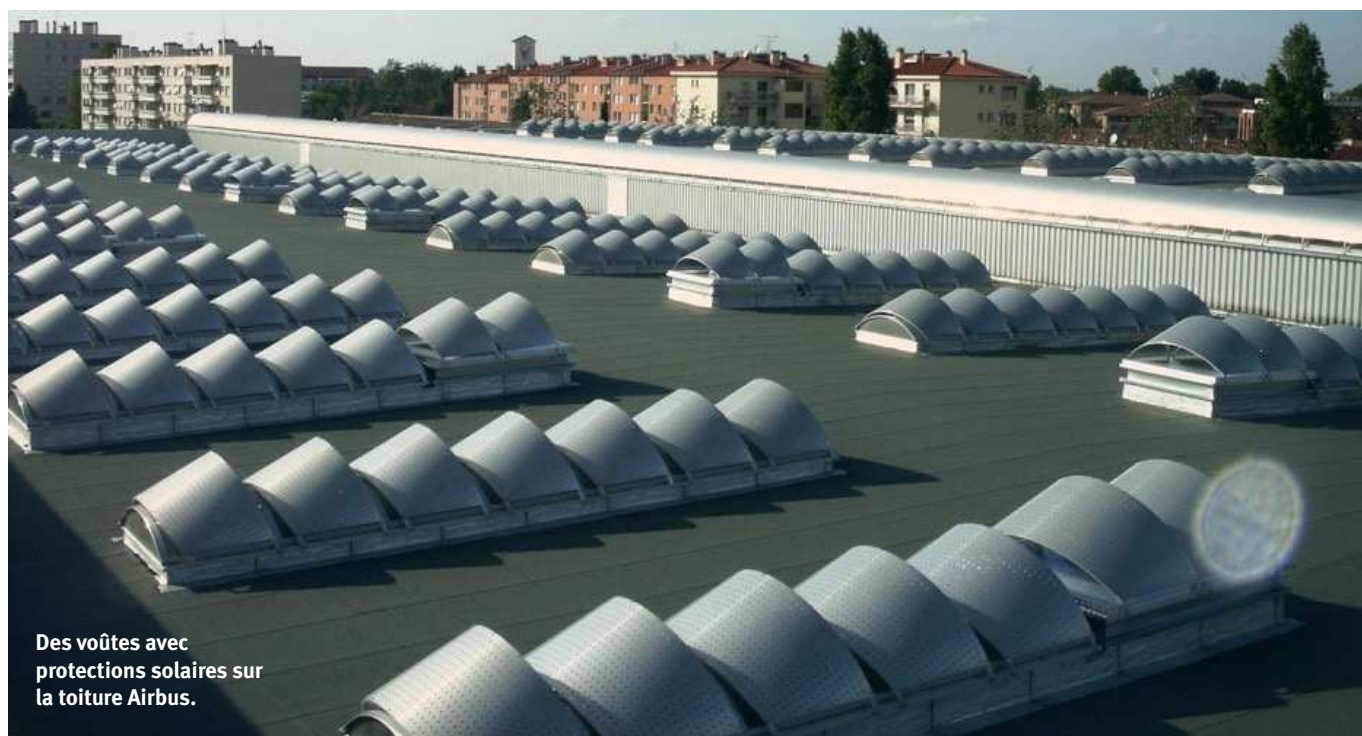
Des voutes avec protections solaires sur la toiture Airbus.

PRODUITS COMPLEMENTAIRES : Voile-Dôme est disponible sur les gammes Bluesteel Therm et RPT, Bluecoif Therm, & Bluevoûte Therm, en confort ou désenfumage .