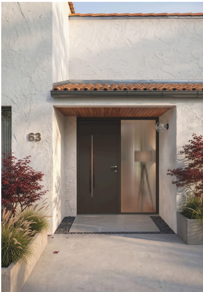
Porte d'entrée aluminium JENS