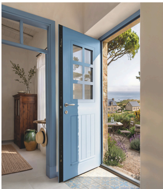
Porte d'entrée aluminium GRIGNAN

Entre héritage et modernité, Bel'M revisite les codes régionaux à travers une gamme dédiée à la rénovation, pensée pour s'inscrire avec justesse dans les architectures locales tout en intégrant des évolutions techniques contemporaines.