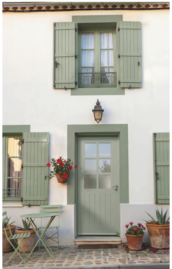
Porte d'entrée acier GIVERNY

Déclinée en aluminium et en acier, cette gamme offre une grande liberté de choix, s'adaptant aussi bien aux budgets qu'aux contextes architecturaux et environnementaux. Des modèles tels que GRIGNAN, avec son châssis ouvrant favorisant l'apport de lumière et d'air, BEAUVOIR, pensé pour certaines configurations de maçonnerie, ou encore GIVERNY, adapté entre autres aux environnements côtiers, illustrent cette démarche.