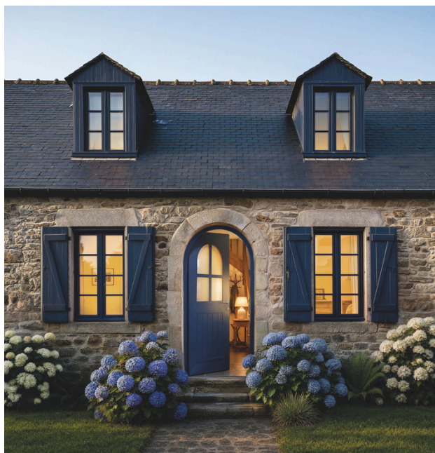
Porte d'entrée aluminium BEAUVOIR