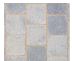
Signature Vieilli Onyx Nuancé