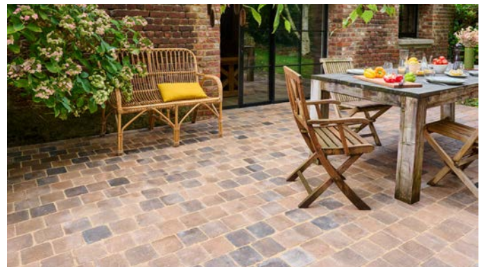
Signature Vieilli Terre Ombrée