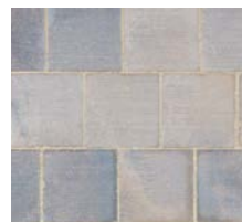
Signature Classique Terre Ombrée