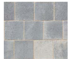
Signature Classique Onyx Nuancé