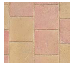
Signature Classique Ambre Doré