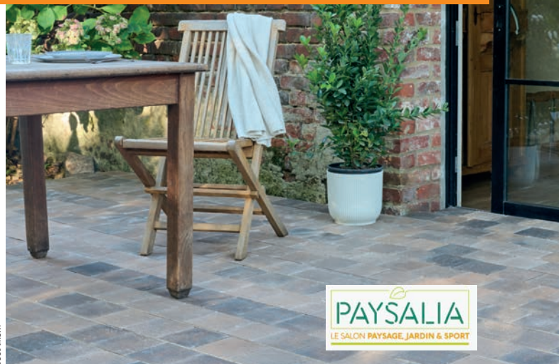
Pavé Signature Classique coloris Terre Ombrée

Paysalia sera une fois encore l'illustration de la force d'innovation d'Alkern. Avec plus de 2 500 références dédiées à l'aménagement extérieur, l'offre Alkern, 100 % française et certifiée, répond en effet à toutes les attentes, qu'il s'agisse de dalles, de margelles, de pavages, de solutions drainantes ou bien encore de piliers et murets... Un éventail de réponses esthétiques qui se décline dans une large palette de coloris et d'aspects pour créer et composer à loisir terrasses, allées, entrées de maison ou encore abords de piscine grâce à l'astucieux concept de Kit margelles de piscine. Et l'industriel, comme de tradition, innove encore pour cette édition 2023 qui sera l'occasion de dévoiler sur son stand (6E102) une nouveauté complétant sa gamme drainante ( dalle Quadro ) mais aussi le pavé Signature en version vieillie ou classique.