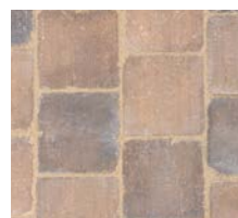
Signature Vieilli Terre Ombrée

Précisons, de plus, que ces pavés Signature se déclinent en trois nuances inédites et harmonieuses d'Ambre Doré, d'Onyx Nuancé et de Terre Ombrée. Et comme toujours chez Alkern, s'ils revendiquent résistance au gel, au salage ( Classe B et D ), à l'abrasion ( classe H ), ils revendiquent aussi un effet antidérapant notoire. Les pavés Signature ( 138 kg au m² ) peuvent être carrossables par des véhicules légers ( classe T5 ). Enfin, les pavés Signature sont commercialisés à partir de 31,83 euros HT euros le m² pour la version classique et de 38,33 euros HT le m² pour le vieillie.