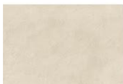
Nacre Dekton® Kraftizen