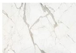
Daze Dekton® Onirika