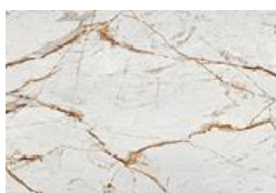
Awake Dekton® Onirika

Cosentino étoffe sa gamme avec 6 nouveaux coloris marbrés qui complètent la palette Dekton®. Signées par l'architecte d'intérieure américaine Nina Magon, les teintes Trance, Awake, Morpheus, Neura, Daze et Somnia, sont issues d'un voyage onirique, peuplé de rêves où les frontières disparaissent. La collection réunit la beauté poétique et originale des minéraux, associée à la technologie Dekton, elle développe l'imaginaire et sublime tous les espaces. En différentes finitions - mate (Somnia), polie (Trance, Awake) ou velvet (Morpheus, Neura et Daze) - la collection Onirika captive les sens.