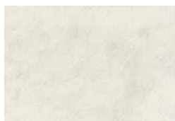
Albarium Dekton® Kraftizen