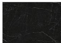
Somnia Dekton® Onirika