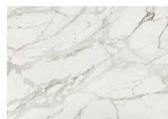
Lucid Dekton® Onirika