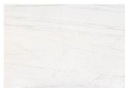
Neural Dekton® Onirika