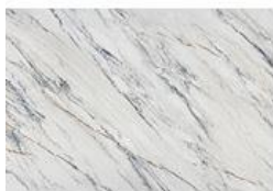
Trance Dekton® Onirika