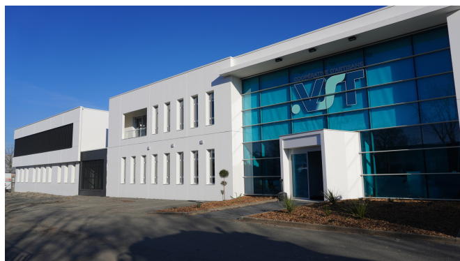
Nouveau siège social VST