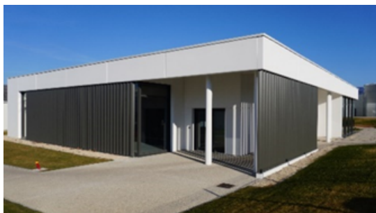
Salle de sport et repos (VST La Ferrière)

• Poitiers (86) : 2000m 2 de dépôt – En 2023 => salle d'exposition Artisans Artipôle Vst et Acem de 1800 m 2