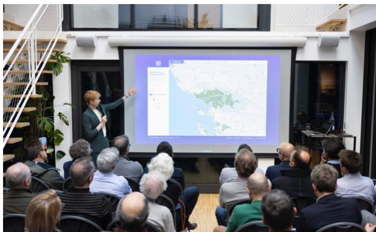
« Les Nocturnes » - Crédit photo : Julien Knaub

Le premier semestre a également été marqué par plusieurs événements fédérateurs tels que la célébration des 40 ans de Reynaers Aluminium en France réunissant 130 collaborateurs sur le site de Brouchy (80) avec la création d'un rituel « les Reynaers Awards » récompensant les