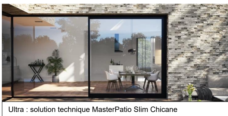
Ultra : solution technique MasterPatio Slim Chicane

Performance , les solutions exclusives qui créent une identité architecturale unique. Des innovations qui permettent de concevoir des bâtiments iconiques et différenciants.