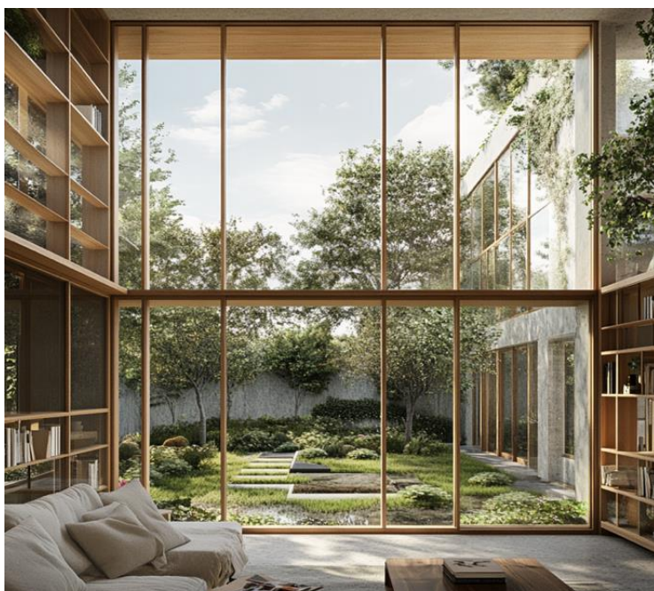
Signature : solution technique TimberWall 50

de Batimat, la solution sera mise en valeur par un mur-rideau démonstrateur de 10 mètres de longueur par 4 mètres de hauteur intégrant une porte.