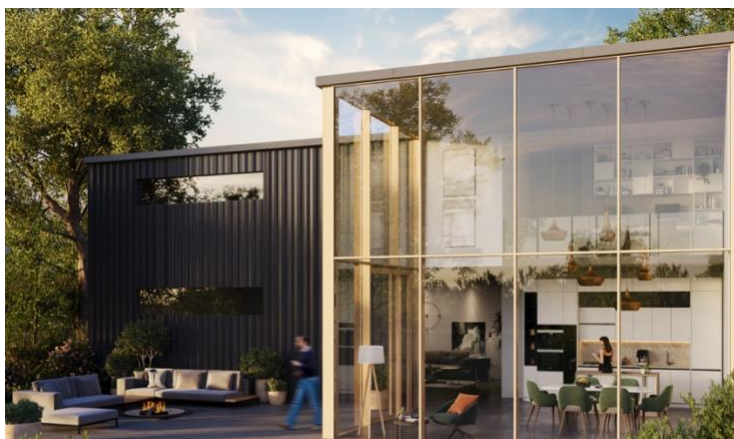
Minimale : solution technique SlimWall 35

(Classic, Cubic, Ferro, Functional). Il permet d'atteindre un U_w de 0,74 W/m 2 K et bénéficie de la classe de résistance RC2.