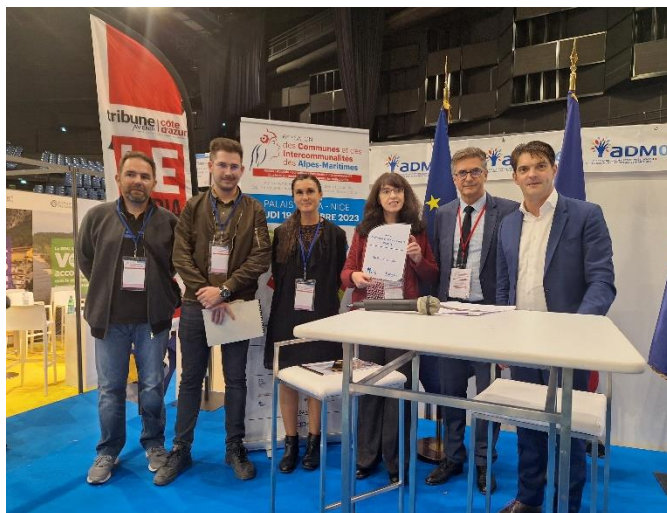
Remise du Prix « CROUS Nice Toulon »