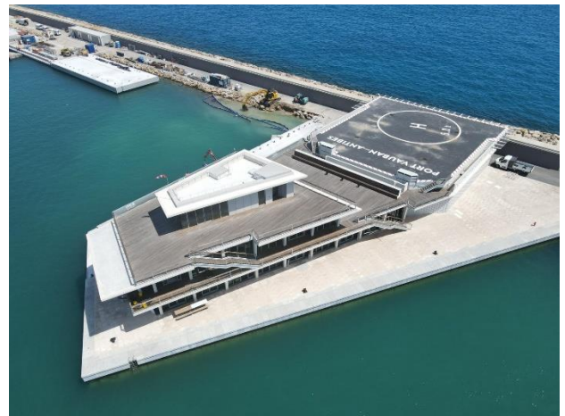
IYCA – Port Vauban, Antibes © Philippe Prost, architecte / AAPP - © Toitures d'Aqui, 2023