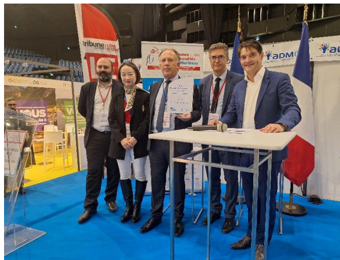
Remise du Prix « SNCF Gares & Connexions »