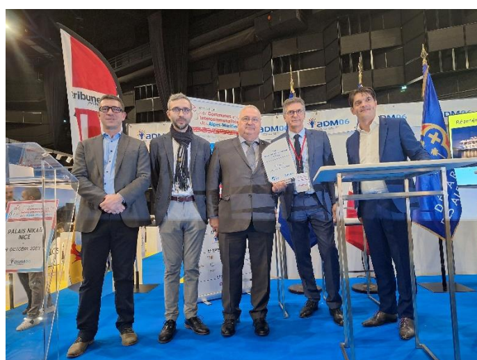
Remise du Prix « Vauban 21 CCI Nice Côte d'Azur »