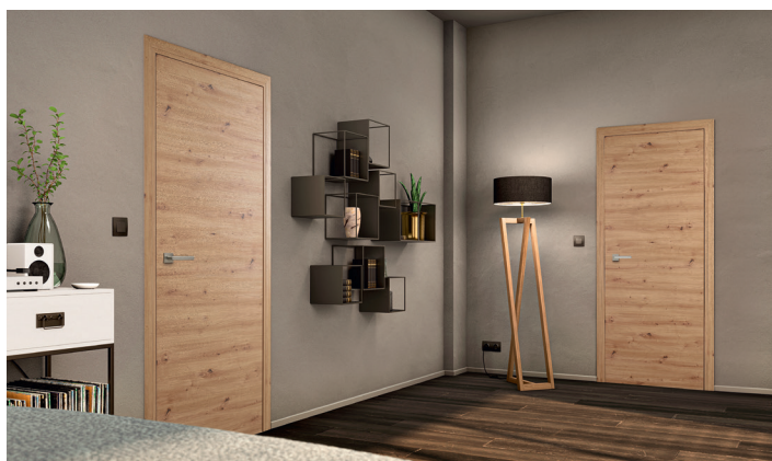
Style Chêne Nouveau