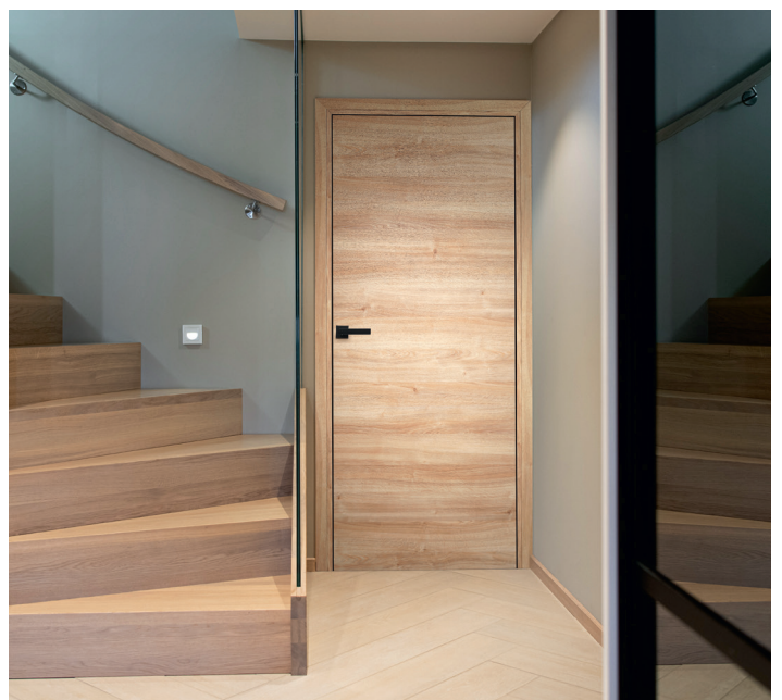
Style Chêne Doré