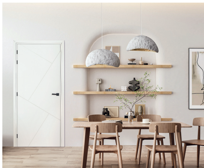
Design Laquée Blanc

Des décors bois marqués, des textures authentiques et des finitions contrastées, avec ou sans vitrage, pour créer une atmosphère chaleureuse et expressive. Cette tendance met en avant le caractère du bois et son authenticité. Les matières sont riches en textures, avec des veinages marqués qui apportent une dimension naturelle et expressive. Les finitions contrastées, parfois adoucies par du vitrage dépoli, renforcent le jeu de relief et donnent de la personnalité aux portes. Les finitions se déclinent dans une palette chaleureuse et conviviale : le chêne blanc pour une luminosité naturelle, le chêne doré pour une chaleur traditionnelle, le chêne nouveau au rendu plus rustique et authentique, ou encore le chêne brun qui diffuse une profondeur élégante et cosy.