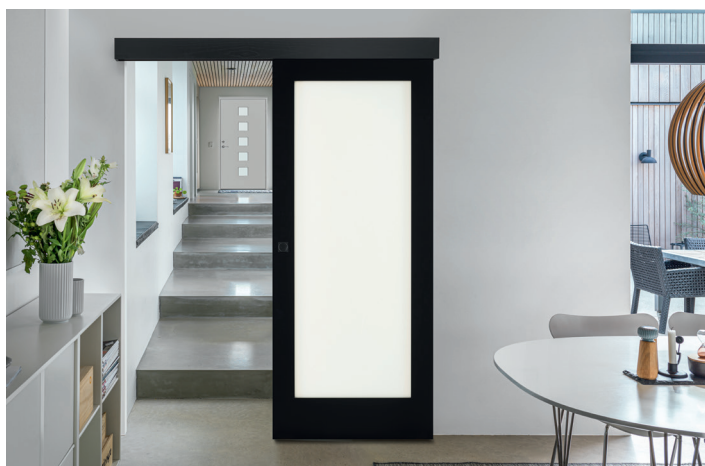
Eternal Vision 1 laquée Noir

Des modèles pleins ou vitrés, en blanc ou en noir, qui incarnent l'élégance intemporelle et s'adaptent à tous les styles. Cette tendance mise sur une dualité élégante et intemporelle. Les surfaces laquées, pleines ou vitrées, offrent un rendu lisse et raffiné. Le noir laqué, sophistiqué, et le blanc laqué, pur et lumineux, forment un contraste harmonieux, garantissant une élégance intemporelle et une présence raffinée dans tout intérieur.