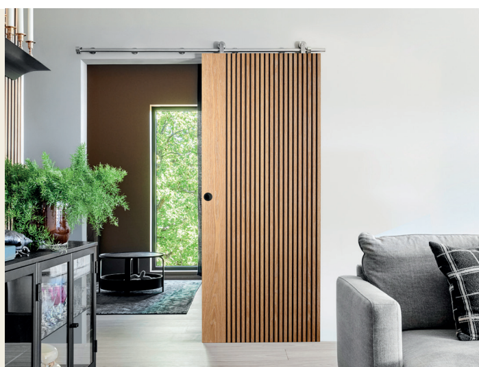
Tendance Chêne coulissante

Le choix des portes intérieures ne relève pas du hasard. Véritables éléments d'aménagement intérieur, elles délimitent les espaces tout en participant à l'esthétique générale d'un appartement ou d'une maison qu'il s'agisse d'un style industriel, contemporain, traditionnel ou moderne. Leur fonction dépasse la seule dimension décorative : l'organisation des pièces, l'isolation thermique et acoustique constituent des critères déterminants.