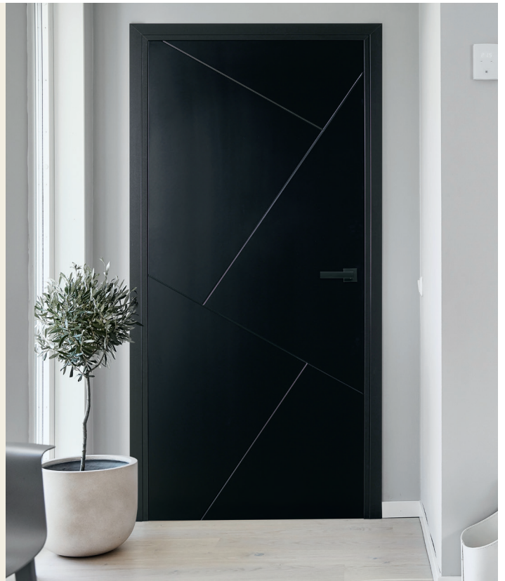
Design laquée Noir