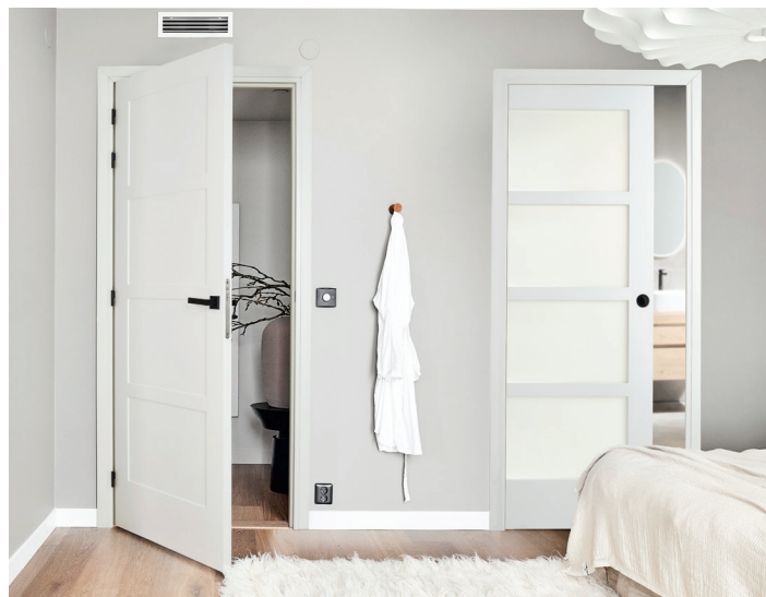
Eternal 4 & Vision 4 coulissante laquées Blanc