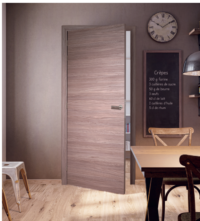
Style Chêne Brun

Elle s'adapte à la diversité des intérieurs du logement collectif à la maison individuelle, en valorisant les espaces sans complexifier la pose.